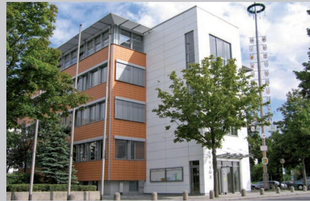
Stefan Kolbe 1. Bürgermeister